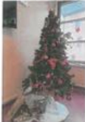
Sapin n° 15