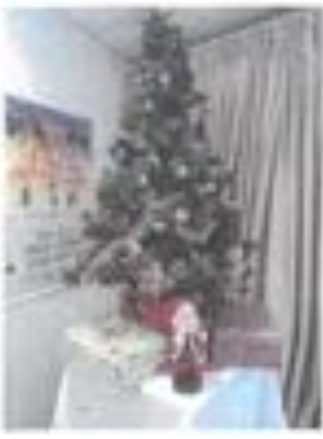
Sapin n° 1