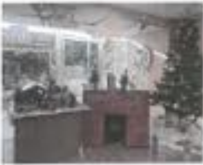
Sapin n° 5