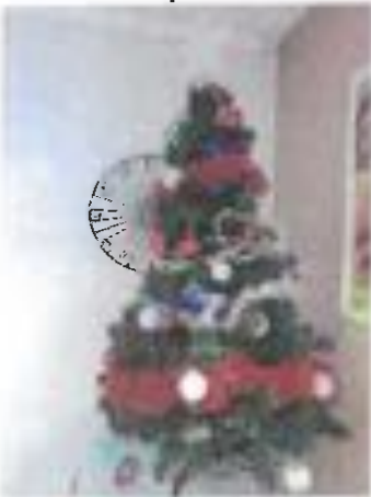
Sapin n° 9