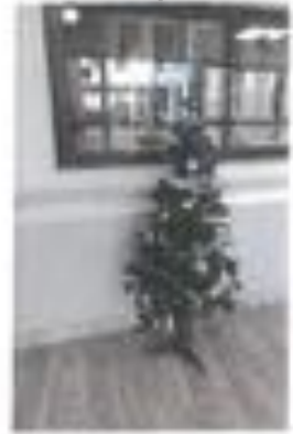
Sapin n° 8