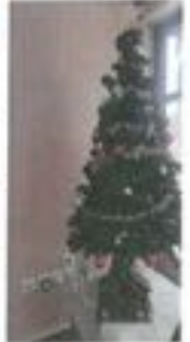
Sapin n° 16