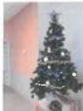
Sapin n° 7