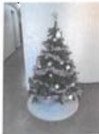
Sapin n° 3