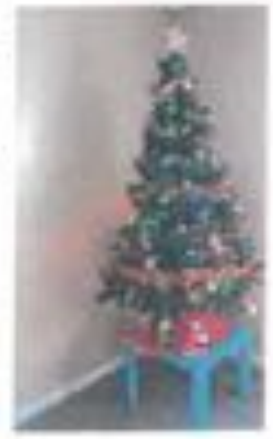
Sapin n° 12