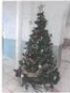
Sapin n° 6