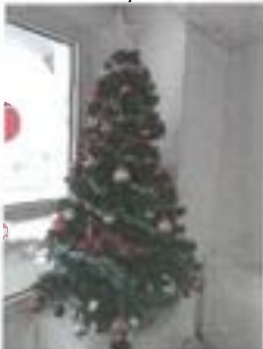
Sapin n° 14