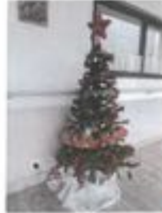
Sapin n° 11