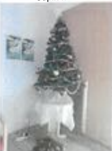
Sapin n° 13