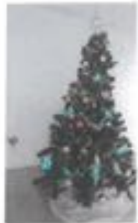
Sapin n° 4