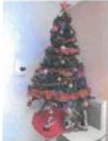
Sapin n° 10