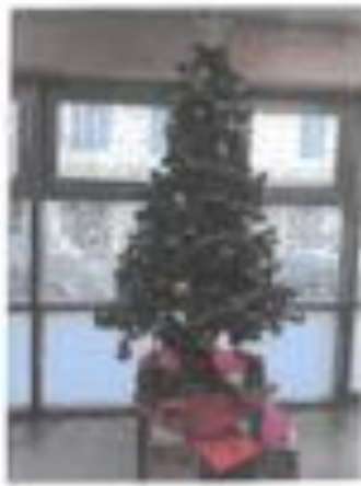
Sapin n° 2